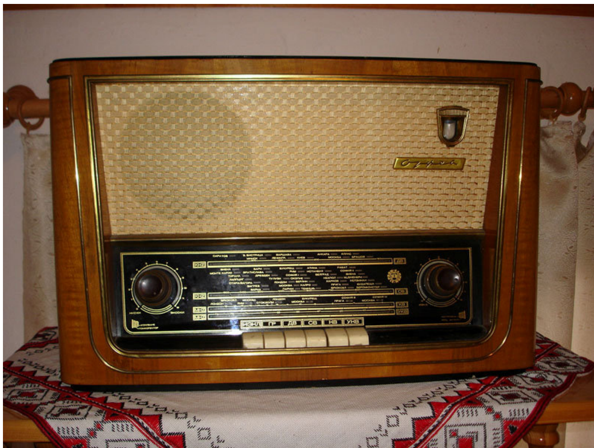
Фиг. 1. Радиоприемник „Орфей”

„Орфей” (фиг. 1.) е настолен комбиниран радиоприемник за приемане на амплитудно и честотно модулирани сигнали. Оформен е в красива дървена кутия с клавишно превключване на честотните обхвати. В него е вградена въртяща се феритна антена за средни и дълги вълни, позволяваща при известни обстоятелства намаляване на паразитните смущения. Използвани са радиолампи от серията E80.